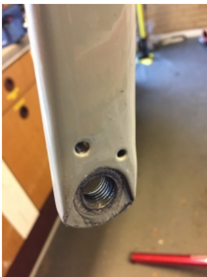
Der er monteringshuller til skærme