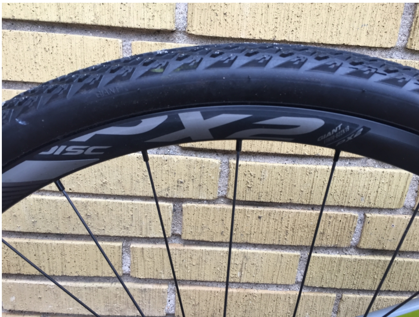
Giants egne aluhjul fungerer også fint. Lidt tunge og det er en oplagt carbonopgradering.