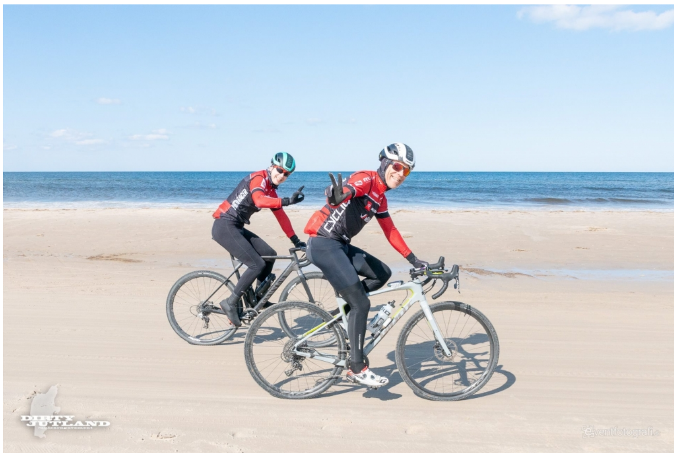
En 7 km tur på stranden er en fed og anderledes oplevelse

Komforten opnås ved at vælge: de rigtig dæk, det rigtige tryk i dækkene, en komfortabel sadde, et tykt styrbånd, en god tyk chamois i buksen og måske en slags fleksende saddelpind. Derudover et det op til dig at gøre turen komfortabel og et godt råd er: træne din kernemuskulatur og smidighed, køre lange ture på grus og græs, samt sørg for at sidde foroverbøjet på cyklen. Jo mere oprejst jo mere gumpetung bliver man og dermed forplantes alle stød op i rumpe og ryg. Ben, arme og overkrop skal følge terrænet i en rytme der passer, så bliver selv den lange Dirty Jutland sjov og fornøjelig.