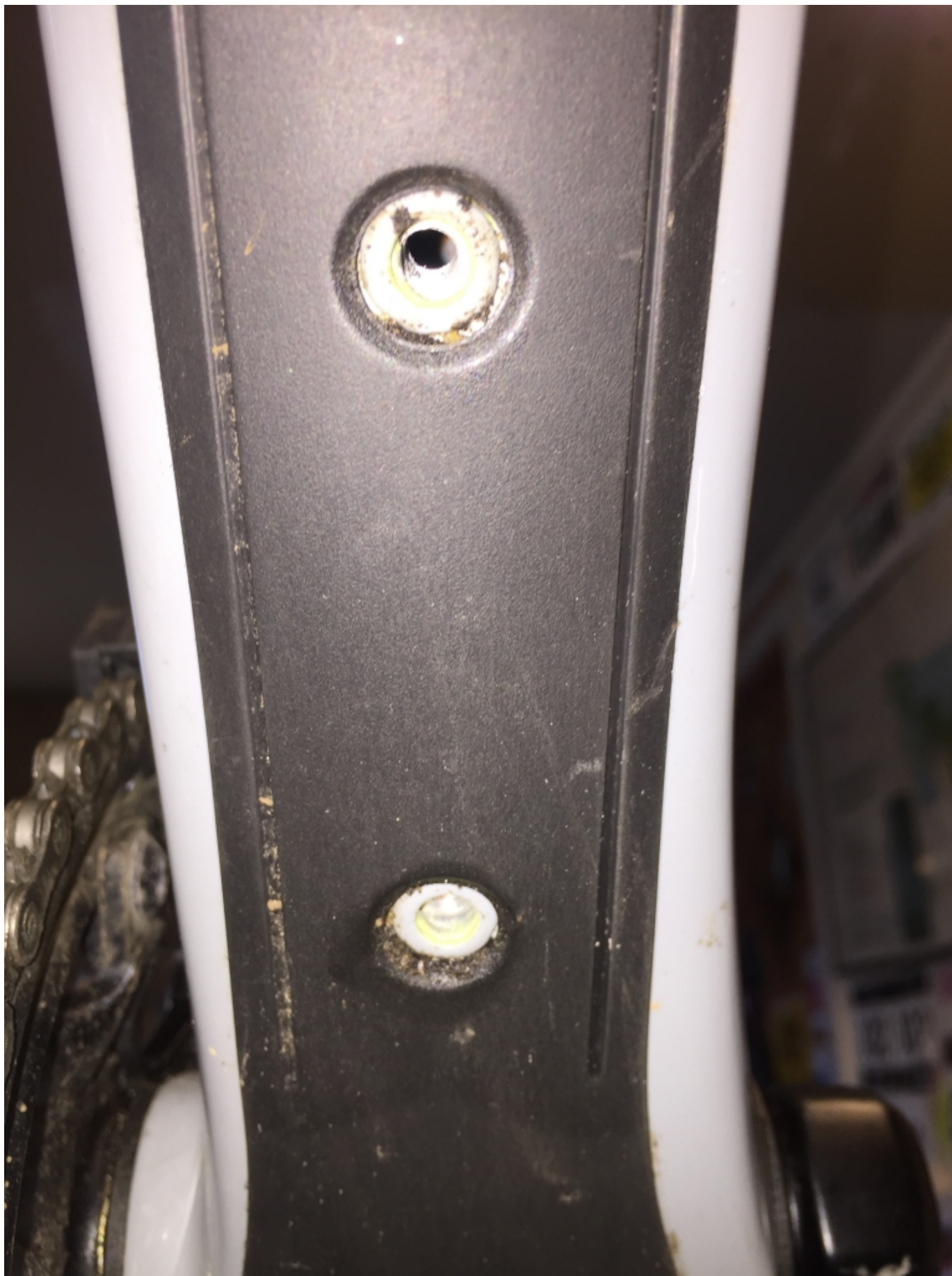
Under skrårøret er der mulighed for flaskeholder nr. tre, for den seriøse long hauler og bikepacker. Der er også stenslags beskyttelse.