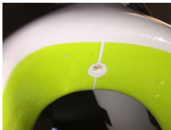
Og hul til skærm under forgaflen.