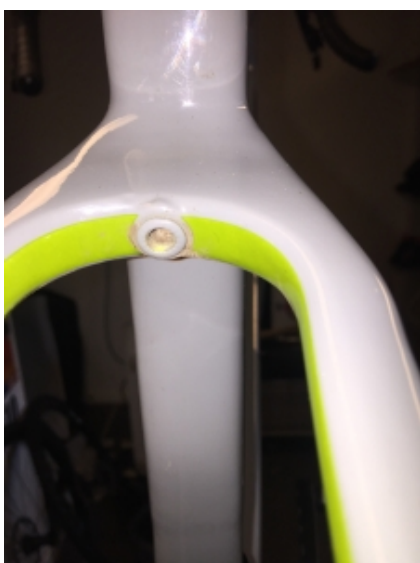
Hul til skærmmontering mellom saddestræberne