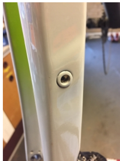
Og til mere oppakning på forgaflen